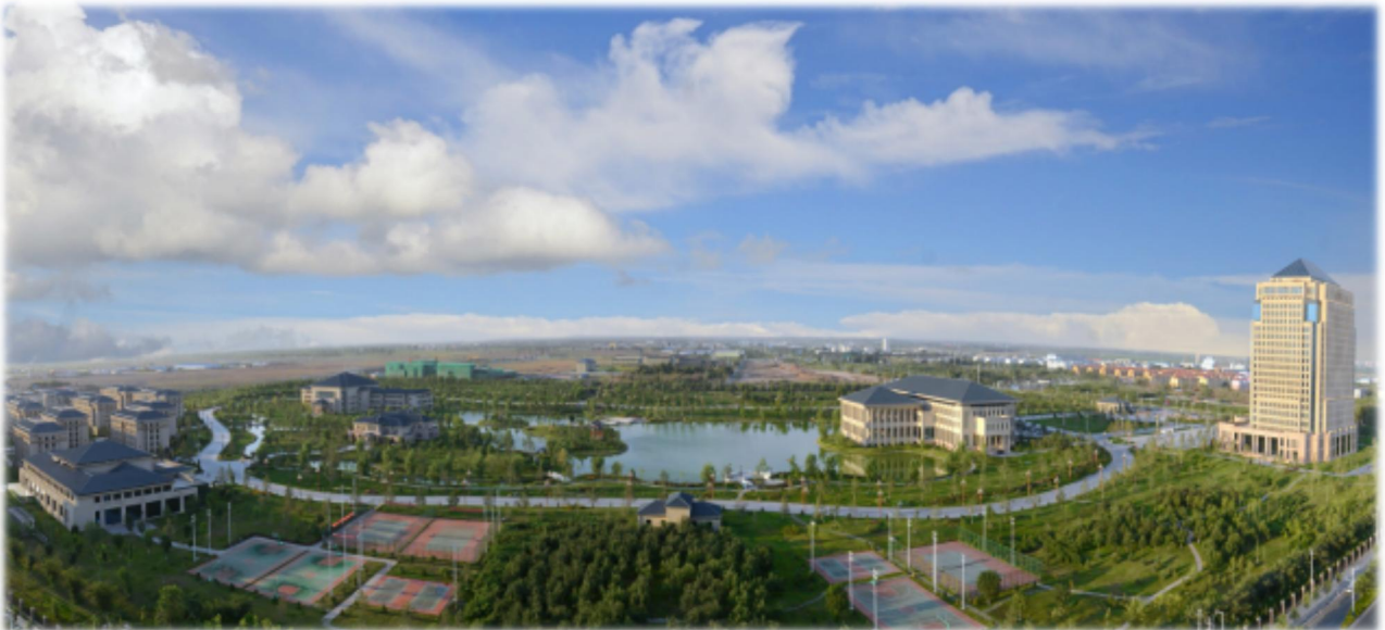
上图：特变电工商务区总部