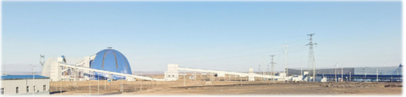
上图：将二露天煤矿