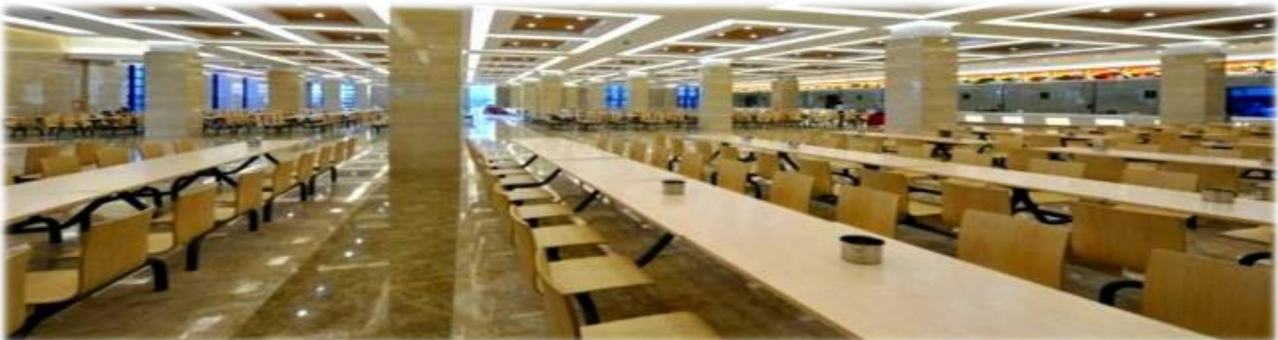
上图：食宿环境（商务区及项目公司）